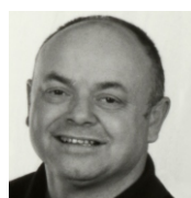
Bert Bitterer Architekturbüro München

Die ThermenLandschaft bietet ihren Besuchern auf einer Wasserfläche von 1007 m 2 pures Vergnügen.