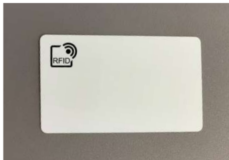
RFID Datenträger | Karte