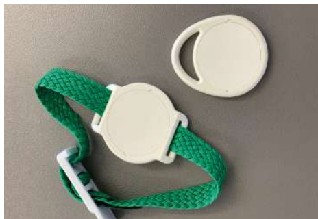
RFID Datenträger | Chip